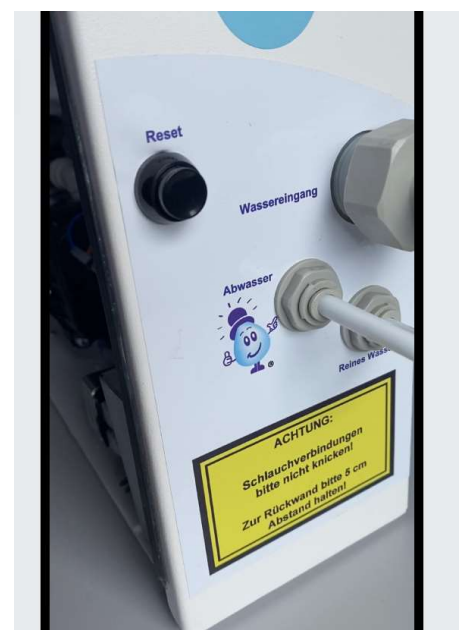
Blanca Pro Reset (= wie bei Arctica)